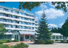
Berolina Klinik Löhne/Bad Oeynhausen