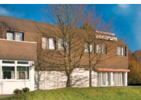
Veranstaltungszentrum Löhne/Bad Oeynhausen

Das Aus- und Weiterbildungsinstitut Ostwestfalen-Lippe (WOP) hat eine praxisnahe, anwendungsbezogene und qualitativ hochwertige Vermittlung von Kenntnissen im Bereich der Psychotherapie/ Psychosomatik zum Ziel.